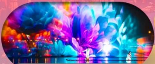
หมู่บ้านเมียนฮัววาน ชมแสงสียามค่ำคืน

เชียงไฮ้ ทางโจว ล่องเรือทะเลสาบซีหู อุ๊ซี