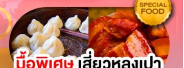
มือพิเศษ เสี่ยวหลงเปา หมูตงพอ ซิโครงหมู เดินทาง ม.ค. - มี.ค. 69