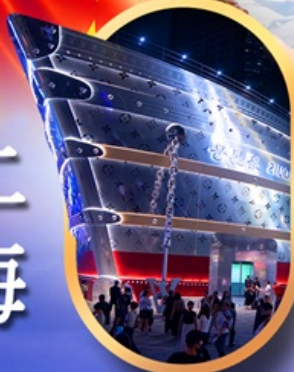
เรือคอะทูลย์