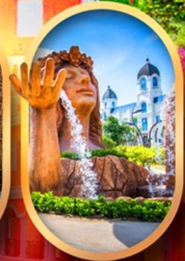
น้ำตกเทพพิหญิง