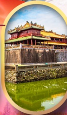
พระราชวังไคโน้ย