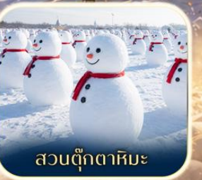
สวนตุ๊กตาหิมะ