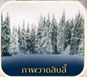
ภาพวาดสิบลี