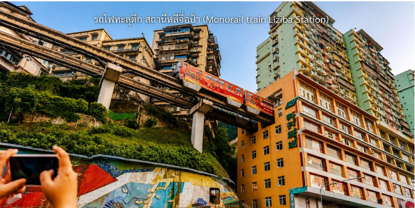
รถไฟทะลุตึก สถานีหลี่จื่อป่า (Monorail train Liziba Station)

จากนั้นนำท่าน นั่งรถไฟทะลุตึก (Monorail Train) หนึ่งในประสบการณ์ที่น่าสนใจและเป็นเอกลักษณ์ในเมืองฉงชิ่ง รถไฟเส้นนี้มีเส้นทางที่ผ่านอาคารและที่อยู่อาศัย ทำให้ผู้โดยสารรู้สึกเหมือนกำลังนั่งรถไฟที่ทะลุผ่านตึกสูง เส้นทางที่น่าสนใจในรถไฟนี้รวมถึงสถานีที่มีชื่อเสียง เช่น สถานีหลี่จื่อป่า (Liziba Station) ซึ่งตั้งอยู่ในพื้นที่ที่มีความหนาแน่นของประชากร การนั่งรถไฟทะลุตึกนี้เป็นวิธีที่ยอดเยียมในการสัมผัสกับวัฒนธรรมเมืองฉงชิ่ง และชื่นชมกับการพัฒนาเมืองที่น่าทึ่ง หากคุณมีโอกาสไปเยือนฉงชิ่ง อย่าลืมลองนั่งรถไฟเส้นนี้เพื่อสัมผัส