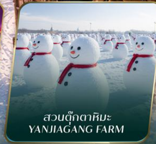
สวนตุ๊กตาหิมะ YANJIAGANG FARM