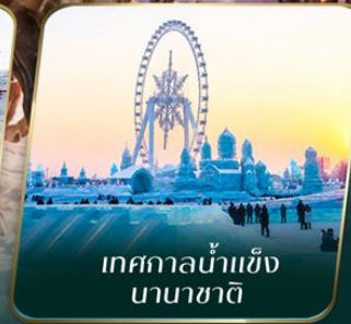
เทศกาลน้ำแข็ง นานาชาติ