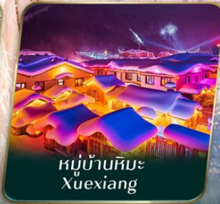
หมู่บ้านหิมะ Xuexiang