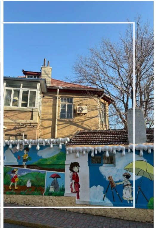
ถนนหลงเจียง (Longjiang Road)

นำท่านสู่ ถนนคนเดิน Silver Fish หรือที่รู้จักในชื่อภาษาจีนว่า “Yutai Road” ตั้งอยู่ในย่านใจกลางเมืองชิงเต่า เป็นหนึ่งในแหล่งท่องเที่ยวและแหล่งช้อปปิ้งยอดนิยมที่สะท้อนสีสันและวิถีชีวิตของคนท้องถิ่นได้อย่างชัดเจน ถนนสายนี้มีชื่อเสียง