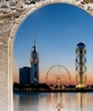
บาทุมึ BLACK SEA BOULEVARD