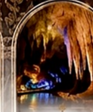
ดำโพรมึร์ริส BOAT RIDE

เดินทางช่วงปีใหม่ 27 ร.ค. - 3 ม.ค. 70 ราคาเพียง 75,989 บาท / ท่าน