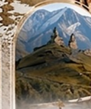
คาสเบกี 4WD EXPERIENCE