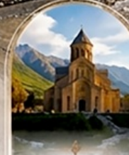
มัทสเคต้า UNESCO HERITAGE