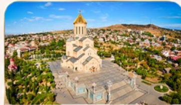
โบสร์กรินิตี้