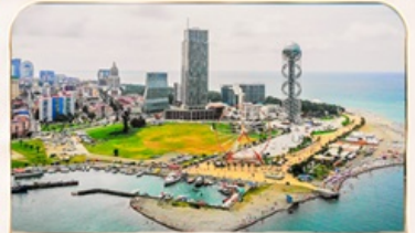
เมืองชายทะเล บาดูมี