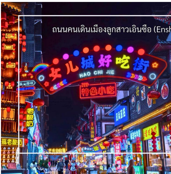
ถนนคนเดินเมืองลูกสาวเินซือ (Enshi Daughter City Pedestrian Street)

สมควรแก่เวลานำท่านสู่ เมืองลูกสาวเินซือ (Enshi Daughter City Pedestrian Street) (ใช้เวลาประมาณ 3 ชั่วโมง) ที่นี้เรียกอีกชื่อว่า ถนนคนเดินเมืองลูกสาวเินซือ เป็นศูนย์กลางกิจกรรมท้องถิ่นที่เต็มไปด้วยสีสันและวัฒนธรรมของเินซือ ถนนเส้นนี้เต็มไปด้วยร้านค้า ร้านอาหาร และแผงขายสินค้าพื้นเมือง ทั้งของฝาก งานหัตถกรรม และอาหารท้องถิ่น ทำให้นักท่องเที่ยวได้สัมผัสวิถีชีวิตของคนท้องถิ่นอย่างใกล้ชิด บรรยากาศในยามค่ำคึกคักมีชีวิตชีวา แสงไฟประดับถนนสวยงามตัดกับภูมิทัศน์เมืองเก่า และมีมุมถ่ายภาพสวยๆ ให้ผู้มาเยือนได้เก็บความประทับใจ