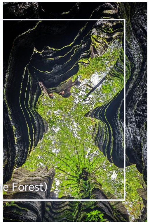
ป่าหินโซบู่ยาสโตนฟอเรสต์ (Suobuya Stone Forest)