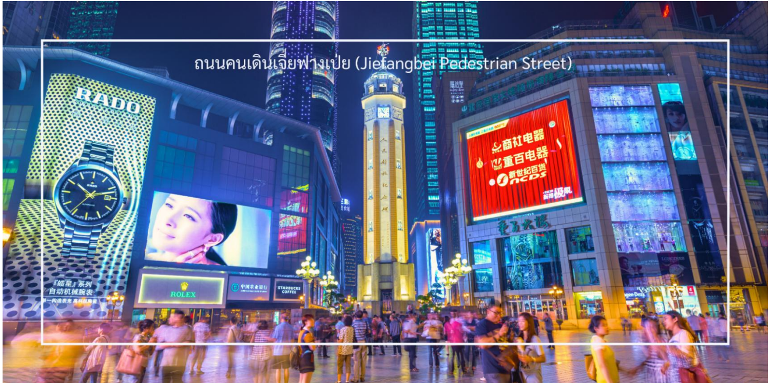
ถนนคนเดินเจี๋ยฟางเป่ย์ (Jiefangbei Pedestrian Street)