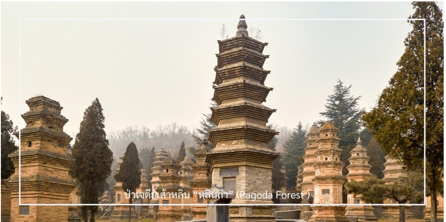
ป่าเจดีย์สี่เหลี่ยม “หลินถ่า” (Pagoda Forest)

ภายในบริเวณเต็มไปด้วยเจดีย์หินจำนวนมากกว่า 240 องค์ ซึ่งบางองค์มีความสูงถึง 15 เมตร เจดีย์แต่ละองค์มีขนาดและรูปร่างแตกต่างกันไปตามยุคสมัย เช่น ทรงกลม ทรงสี่เหลี่ยม และทรงหกเหลี่ยม อีกทั้งยังประดับด้วยลวดลายแกะสลักอย่างวิจิตรงดงาม บางองค์มีจารึกที่บอกเล่าชีวประวัติของพระภิกษุผู้ได้รับการบูชาขึ้น ๆ