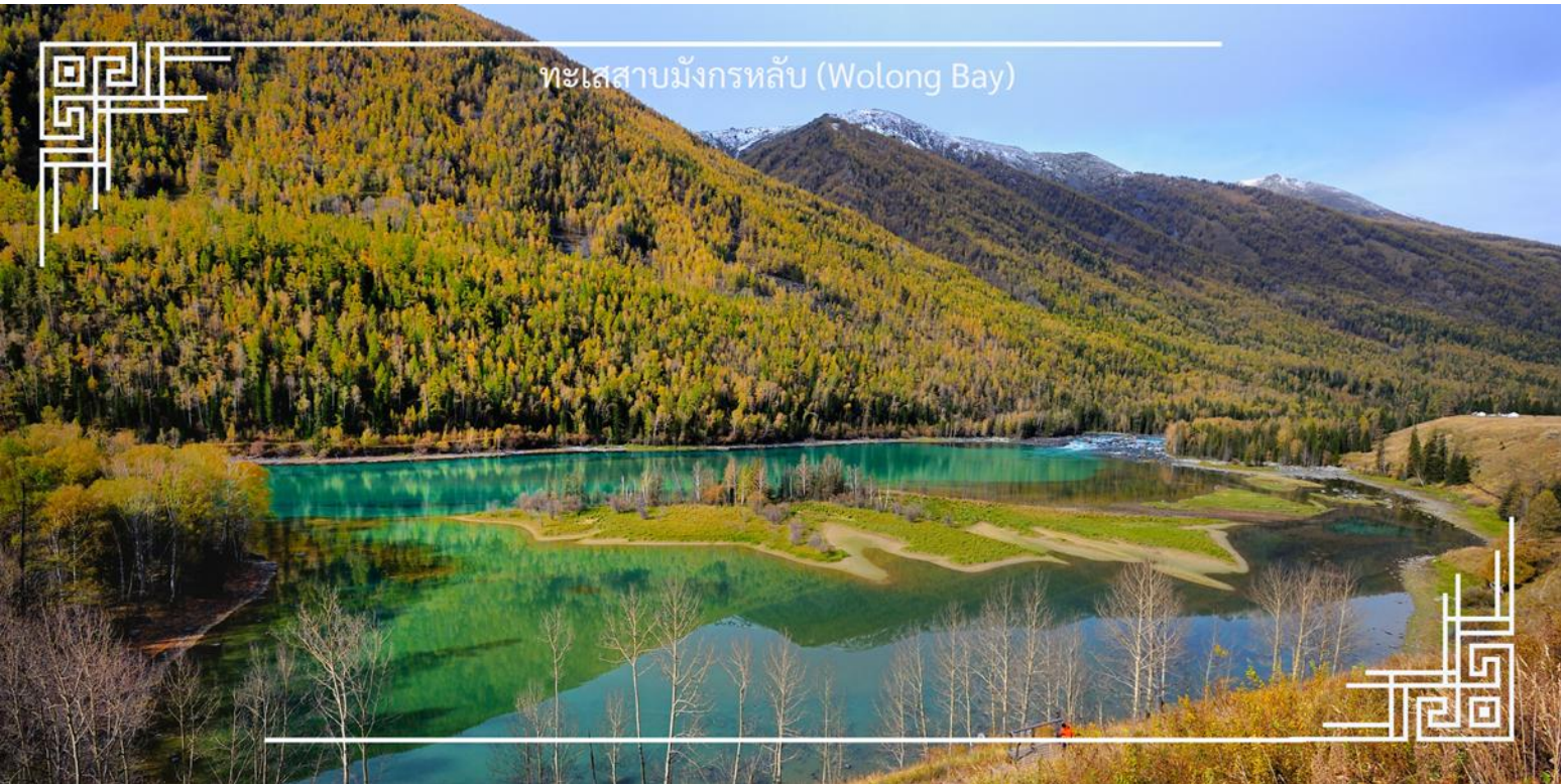
ทะเลสาบมังกรหลับ (Wolong Bay)

จากนั้นนำท่านชม ทะเลสาบเทวดา (Fairy Bay) จุดชมวิวยุคไฮไลท์ที่ตั้งอยู่ทางตอนใต้ของทะเลสาบคานาสีอ ภายในเขตโดดเด่นด้วยผืนน้ำใสสะท้อนเงาภูเขาและผืนป่า สร้างบรรยากาศราวดินแดนในเทพนิยาย สถานที่แห่งนี้มีชื่อเรียกตามตำนานท้องถิ่นว่า “อ่าวของเหล่าเซียน” โดยเล่าขานกันว่าเป็นสถานที่ที่เหล่าเทพเซียนลงมาเล่นน้ำ จึงยังเพิ่มเสน่ห์และความลึกซึ้งให้กับทัศนียภาพอันงดงาม