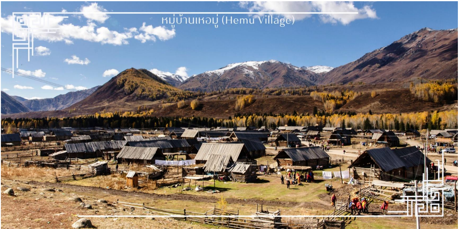
หมู่บ้านเหมอู (Hemu Village)

กันยายน - ตุลาคม (High Season) ช่วงเวลาที่สวยงามที่สุดของปี เมื่อป่าสนเบิร์ชเปลี่ยนสีเป็นเหลืองทองอร่ามทั่ว หุบเขา ตัดกับท้องฟ้าสีครามใส เกิดเป็นทิวทัศน์ฤดูใบไม้ร่วงที่งดงามราวภาพวาด