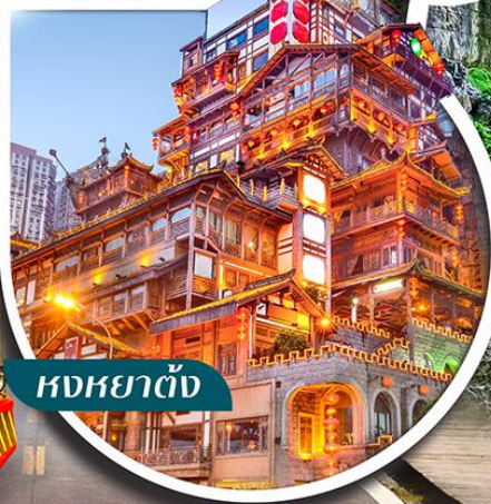
หงหยาดั่ง