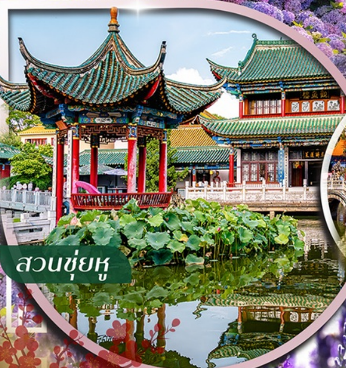
สวนชู่ฮู่