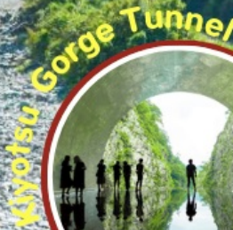
Kiyotsu Gorge Tunnel