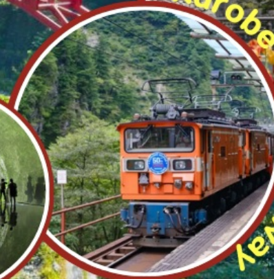
Kurobe Gorge Railway