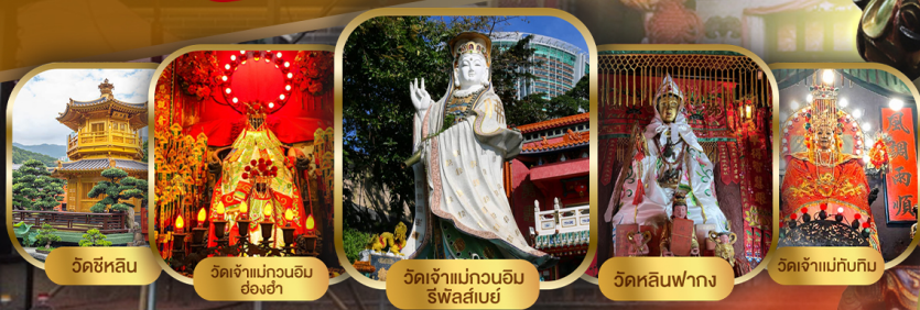
วัดซีหลิน วัดเจ้าแม่กวนอิม ย่องซ่า วัดเจ้าแม่กวนอิม ริฟาสึบะ วัดหลินฟาง วัดเจ้าแม่ทับทิม