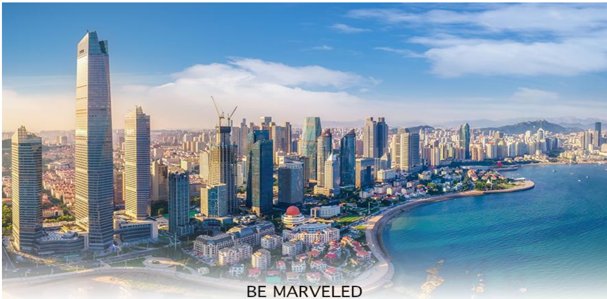
BE MARVELED เมืองชิงเต่า

02.25 น. ออกเดินทางสู่ สนามบินชิงเต่า โดยสายการบิน Shandong Airlines (SC) เที่ยวบินที่ SC4080 บริการ SNACK บนเครื่อง 07.58 น. เดินทางถึง สนามบินชิงเต่า เมืองชิงเต่าเป็นเมืองชายทะเลที่ตั้งอยู่ทางตอนใต้ของมณฑลซานตง ประเทศจีน มีชื่อเสียงจากบรรยากาศที่ผสมผสานระหว่างสถาปัตยกรรมสไตล์ยุโรปสมัยอาณานิคมกับความทันสมัยของจีนอย่างลงตัว เมืองนี้เป็นเมืองที่รู้จักในฐานะบ้านเกิดของเบียร์ชิงเต่า (Tsingtao Beer) ที่มีชื่อเสียงระดับโลก