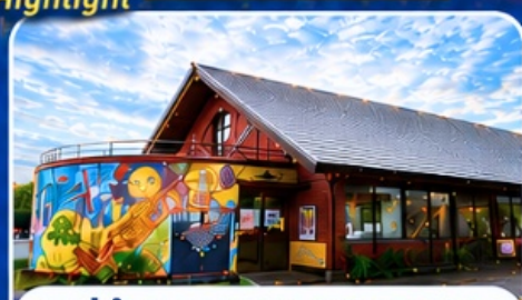
หมู่บ้านราเมนอาซาฮิกาวะ