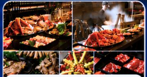
THE SAKURA BUFFET