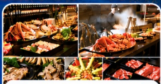
THE SAKURA BUFFET