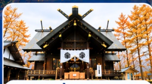
ศาลเจ้าคามิคาวะ