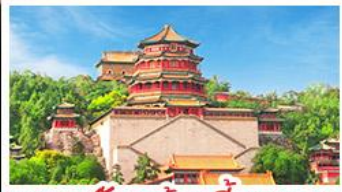
พระราชวังฤดูร้อนอ้อเหอหยวน