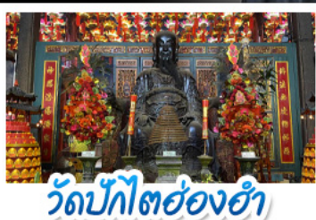
วัดปักไต้ฮ่องกง