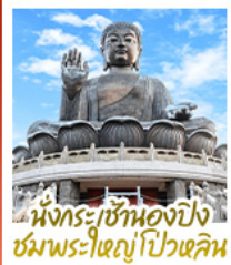
นั่งกระเช้ามองปิง ชมพระใหญ่ไผ่หลิน

นั่งกระเช้ามองปิงสักการะพระใหญ่ไผ่หลิน • วัดหวังต้าเซียน ขอพรสุขภาพ ความรัก วัดเข่งหมิว ขอพรองค์เซกซุ ซิคลาก การเงินและธุรกิจ • เจ้าแม่กวนอิมรีฟาสส์เบย์ รับพลังงานดี เสริมพลังสงจู้ • วัดหมิ่นโหมว ขอพรเรื่องการศึกษ การงาน สติปัญญาและความกล้าหาญ