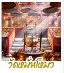
วัดเม่ห็นไฉเมว