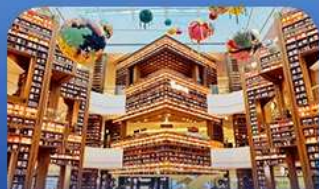
ต๋องกมุดคตาร์ทพีค