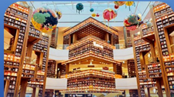
ต๋องสมุคสตาร์ฟิค