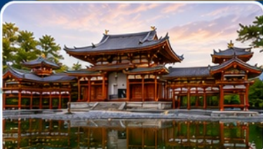
วัดเบียวโดอิน