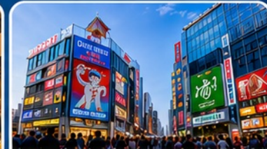
ช้อปปิ้งย่านชินไซบาชิ