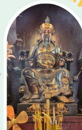
วัดปักไต้