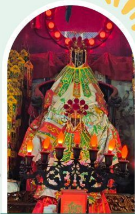
วัดเจ้าแม่กวนอิมองอ่า