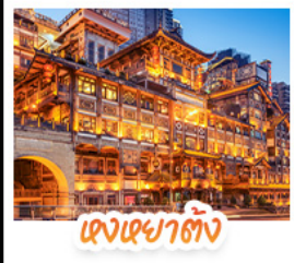
แดงหยาดัง

สัมผัสใบไม้แดงสุดงดงามที่ ภูเขาหมื่นชางซาน และ ภูเขาทองอุ้ยซาน ชมวิวกลางคืนสุดอลังการที่ หงหยาดัง แลนด์มาร์กชื่อดังแห่งฉงชิ่ง สักการะพระโพธิสัตว์เจ้าแม่กวนอิม ณ วัดหลิงฉวน ขอพรเสริมสิริมงคล เช็กอินแลนด์มาร์กสุดฮิต เพนด้าปิ่นตึก IFS + POP MART ช้อปปิ้งจุใจที่ ไท่กุ่หลี่ ถนนคนเดินชุนชู่