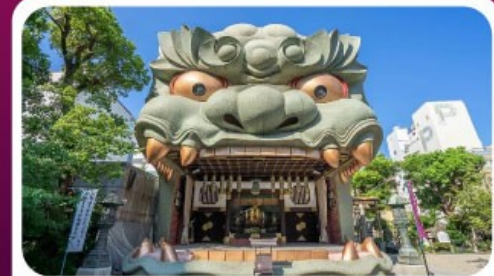
ศาลเจ้านัมมะ ยาชากะ