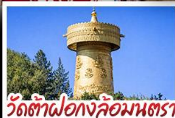
วัดต้าฝอ กงล้อมนตรา