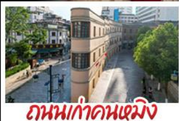
ถนนเก่าคุณหมิง