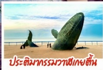
ประติมากรรมวาฬเกยตื้น