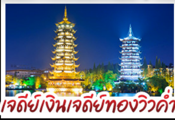
เจดีย์เงินเจดีย์ทองวิวคำ

หมู่บ้านแม่หัวซีเจียง - เขาหญี่ - ภูเขาพันปี เมืองบ่เจียง เขางวงช้าง - เจดีย์เงินเจดีย์ทองวิวคำ - เขาหญี่ ซอปปิงกับถนนคนเดิน ซีเจียง - ซีเจียง แมบพิเศษ บุปไฟซ่าบูซีฟู๊ด ปลายอนเนียร์ เมื่อกคริสตล สุกี้หัด