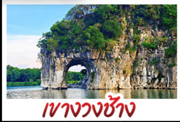
เขางวงช้าง