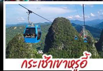
กระเช้าเขาหลูอี้