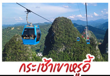
กระเช้าเขาหญี่