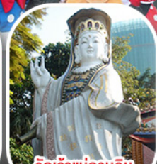
วัดเจ้าแม่กวนอิม รีพัลส์เบย์