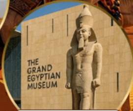
พีพีรภัณฑ์แกรนด์อียิปต์