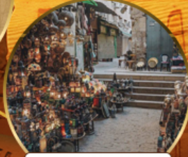
ตลาดบ้านเอลคาลลี