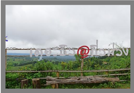
หมอกยามเช้า

เที่ยว ร้านกาแฟ เดอะวิวก๊วม่วง (กาแฟหลักสิบวิวหลักล้าน) คาเฟ่วิวสวย มุมสูงของก๊วม่วง ราคาหลักสิบ วิวหลักล้าน ที่เราจะสามารถมองเห็นดอยภูคาอยู่ด้านหน้า หากไปวันที่อากาศดี ๆ จะได้พบกับเหล่าบรรดาหมอกบริเวณยอดเขา และเป็นอีกหนึ่งจุดชมวิวทะเล