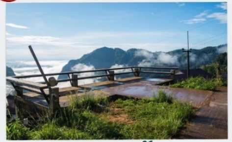
ดอยผาตั้ง