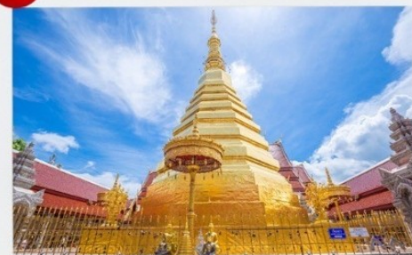
วัดพระธาตุดอยฮ่อ