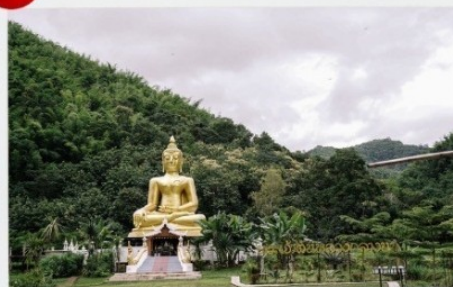
วัดนาคูหา