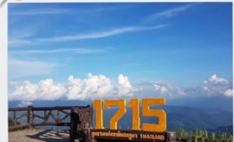
จุดชมวิวที่มีความสูง 1715