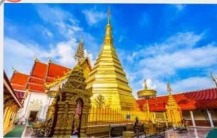
วัดพระธาตุดอยฮ่อ