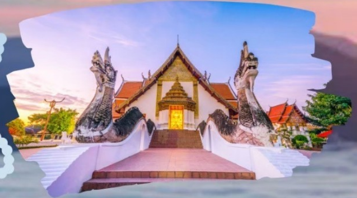
วัดกุ่มินทร์