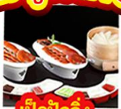
เปิดปีกกึ่ง