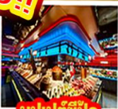
บูฟเฟต์ซีฟู้ด