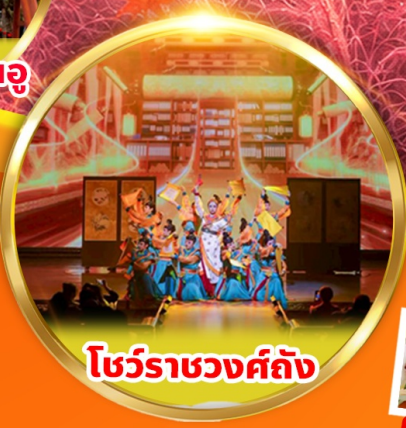
โชว์ราชวงศ์ถัง