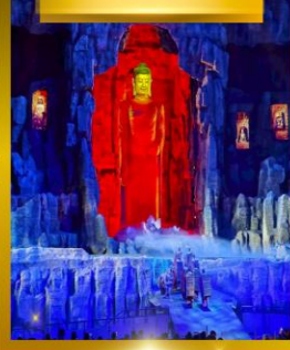
โชว์เส้นทางสายไหม