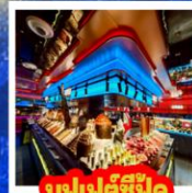
บุฟเฟต์ซีฟู้ด