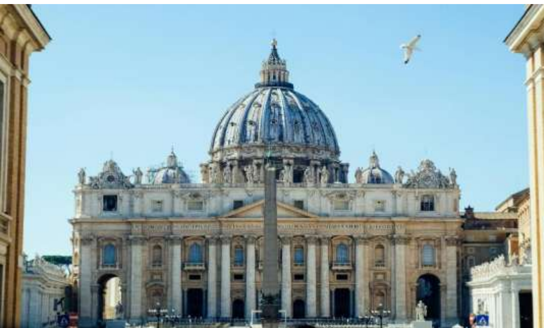
มหาวิหารนักบุญปีเตอร์ ( ST. PETER' BASILICA)

(กรณีมีพิธีด้านใน หรือถ้าหากมีผู้เข้าชมเป็นจำนวนมากจนไม่สามารถเข้าชมได้ทันเวลา ทั้งนี้เพื่อมิให้กระทบต่อกำหนดการท่องเที่ยวอื่นๆ ภายในโปรแกรมทัวร์" อาจจะไม่ได้รับการเข้าชม)