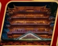
Dafo Buddhist temple