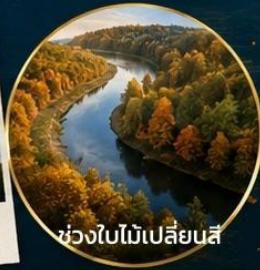
ช่วงใบไม้เปลี่ยนสี