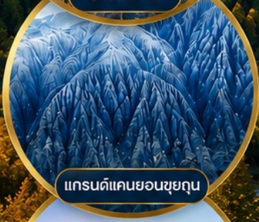
แกรนด์แคนยอนซูยกุน