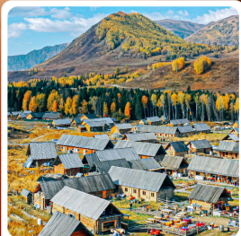
หมู่บ้านเหอจู