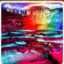
ถ้ำเก้าเทพ