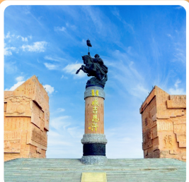
เขตท่องเที่ยวเจงกีสข่าน