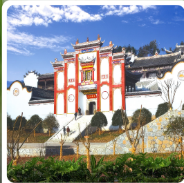
บ้านเกิดชวีหยวน